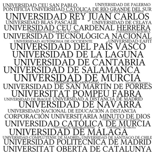
Figura 3. Universidades ofertantes de MOOC en la plataforma Miriada X durante el año 2015.

figura 3 aparecen representadas todas las instituciones de educación superior ofertantes de esta modalidad formativa.