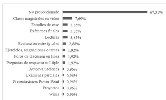
Figura 4. Tipo de actividades de aprendizaje y de evaluación de los MOOC de la plataforma Miriada X.

los estudios de casos, los exámenes finales y las lecturas (3,85%) seguidas de la evaluación entre iguales (2,88%) y, en menor medida, los ejercicios, asignaciones y tareas, los foros de discusión en línea y las preguntas de respuesta múltiple (1,92%).